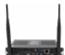
SMART OPS PC-Modul Die Leistungsstärke von Windows® 11 Pro – ganz ohne zusätzlichen Laptop