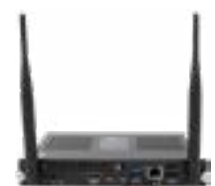
SMART OPS PC-Modul Die Leistungsstärke von Windows® 11 Pro – ganz ohne zusätzlichen Laptop