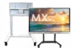
mobile Ständer von SMART Größere Flexibilität und Mobilität