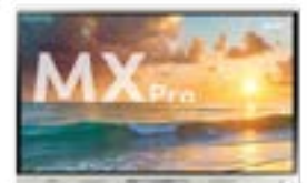
SMART Board® MX Pro Serie Wo sich Produktivität und Zusammenarbeit treffen