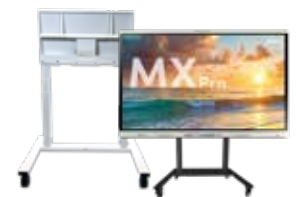
Soportes móviles SMART Añada flexibilidad y movilidad