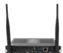
Módulo SMART OPS PC El poder de Windows® 11 Pro, sin necesidad de usar un ordenador portátil