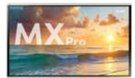
SMART Board® serie MX Pro Donde se unen productividad y colaboración