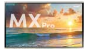
SMART Board® serie MX Pro Donde se unen productividad y colaboración