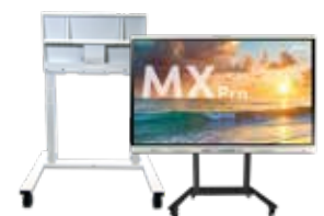
Soportes móviles SMART Añada flexibilidad y movilidad