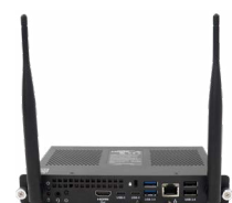
SMART OPS PC-module De kracht van Windows® 11 Pro (laptops niet nodig)