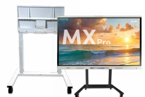
SMART mobiele onderstellen Meer flexibiliteit en mobiliteit