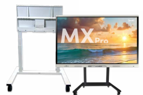
SMART mobiele onderstellen Meer flexibiliteit en mobiliteit