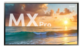
SMART Board®MX Pro-serie Waar samenwerken productief wordt