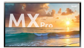
SMART Board®MX Pro-serie Waar samenwerken productief wordt